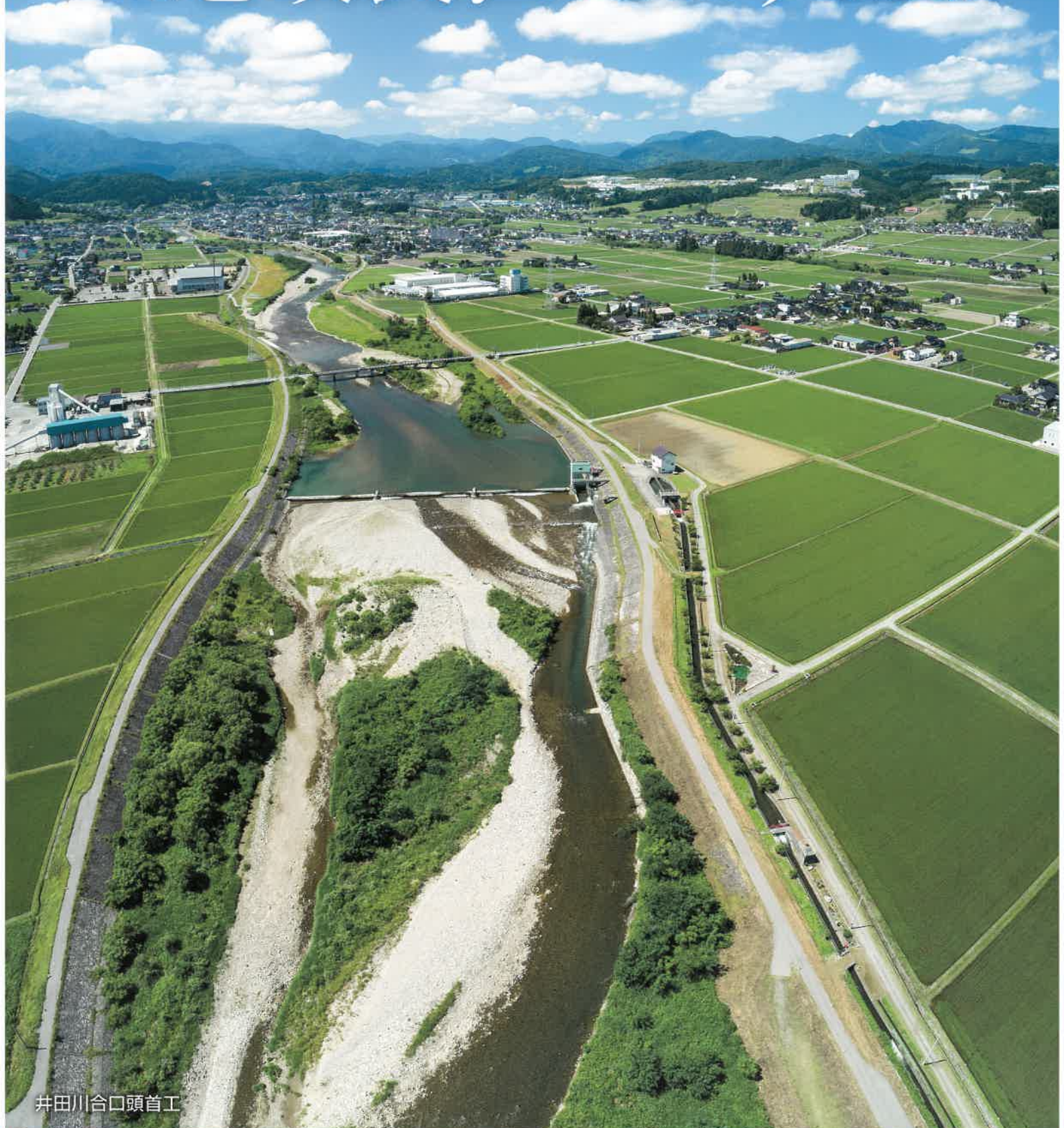
井田川合口頭首工

受益面積及び組合員数(令和3年4月1日現在) 受益面積／1,268.0ha 組合員数／1,623名