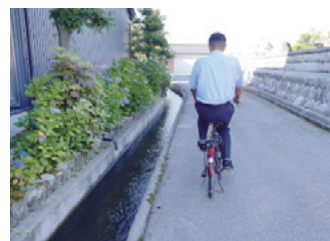
水路沿いの自転車走行