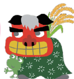
とやま農業農村整備キャラクター ケロとシシィ