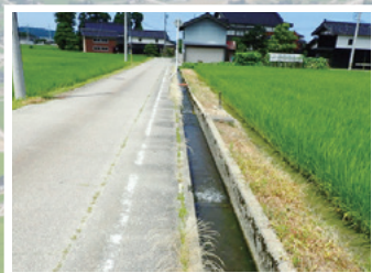
散居集落を流れる用水路