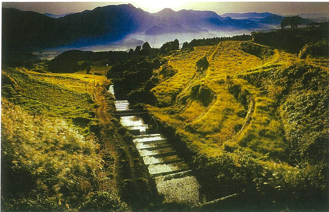
疏水部門2022最優秀賞『岳の棚田と朝霧』