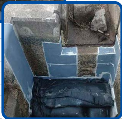
コンクリート柵補修工事