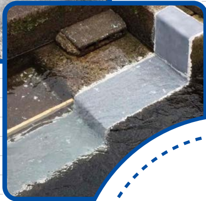
コンクリート水路 水中目地補修