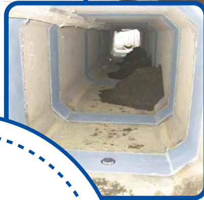
用水路ボックス目地補修工事 (処理用ウィーブホール装着)