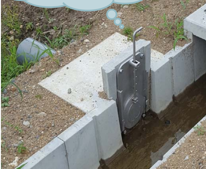
ほ場への 手上式取水ゲート