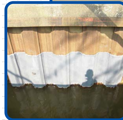
矢板排水路補修工事 (陥没穴箇所補修)