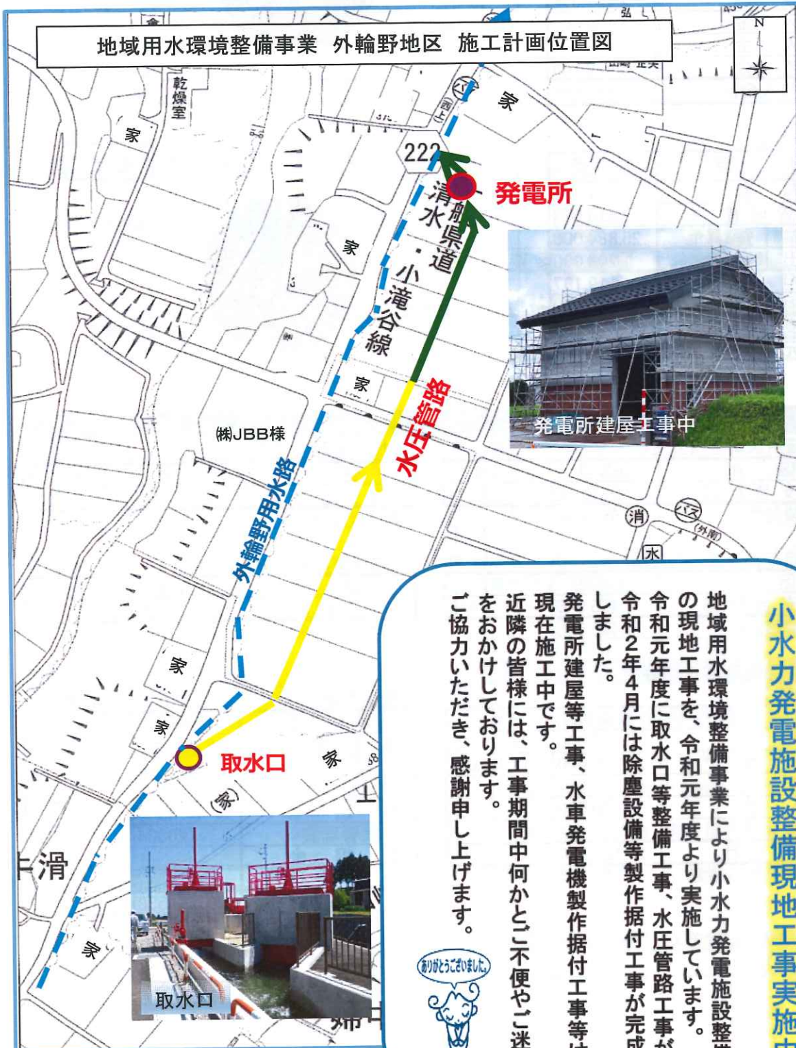
地域用水環境整備事業 外輪野地区 施工計画位置図