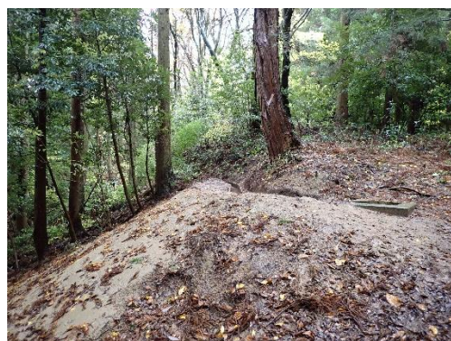
■県単独農業農村整備事業 ■井田地区 ■水路工事