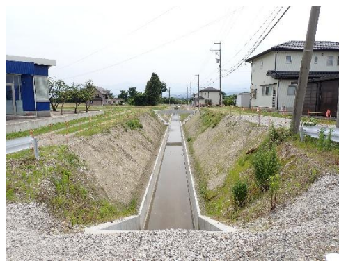
■県営農村地域防災減災事業 ■大杉用水路（薄島地内） ■用排水施設整備