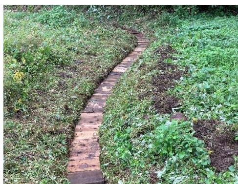
■市補助土地改良事業 ■深谷地区 ■水路木製蓋設置