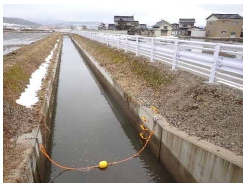
■県営農村地域防災減災事業 ■大杉用水路（杉田地内） ■用排水施設整備