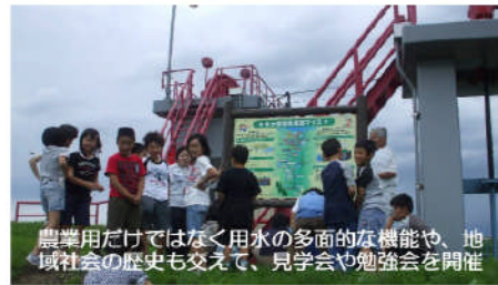
農業用だけではなく用水の多面的な機能や、地域社会の歴史も交えて、見学会や勉強会を開催

見て触れて話して、水土里ネットや農業用水への理解を広めています。また、地域社会を学ぶことにも貢献しています。