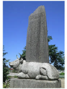
牛ヶ首用水開削記念碑 (牛ヶ首神社)

水土里ネット牛ヶ首用水は、地域社会や教育機関と連携しながら、農業用水の保全活動などを通して、元気な農村づくり、そして豊かなふるさとが未来につながっていくよう努めています。