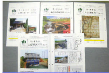
土地改良区だより発行