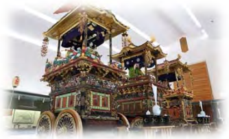
八尾曳山展示館（無料）