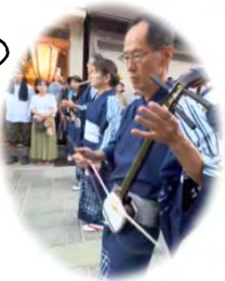
風の盆 胡弓の 生演奏あり♪