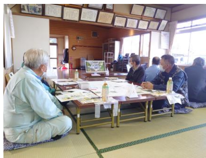
農業用水路の危険箇所を確認し 対策を話し合いました