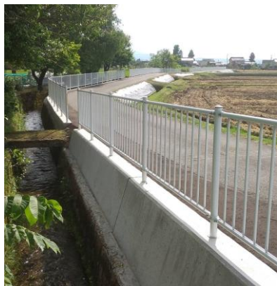
花崎4号用水路 転落防止柵設置工事

事業実施予定の地区におきましては、稲刈り後に着工する予定です。 工事中の通行においてはご迷惑をおかけすると思いますが、ご協力いただきます様よろしく お願いいたします。