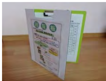
【保全会専用回覧板】