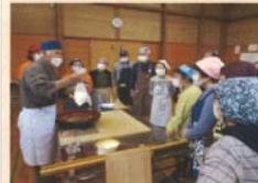
*12月12日 コミュニティセンター で開催された「蕎麦打ち 教室」に使用されました。