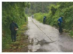
● 地区内一斉清掃 (4月・7月・9月)