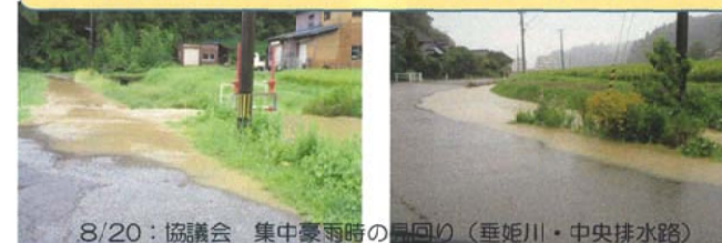
8/20：協議会 集中豪雨時の見回り(垂姫川・中央排水路)