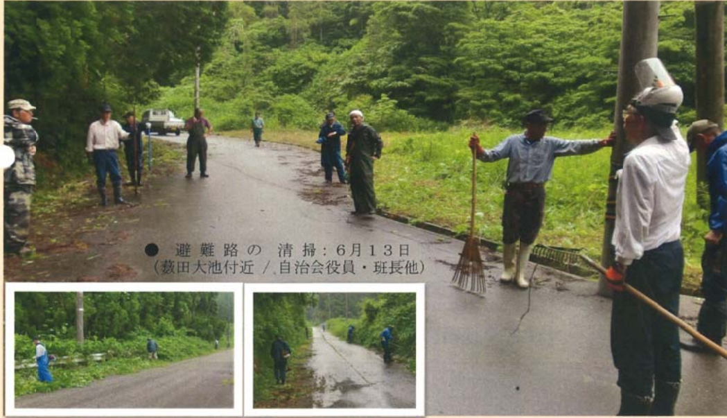
● 避難路の清掃：6月13日 (菽田大池付近 / 自治会役員・班長他)