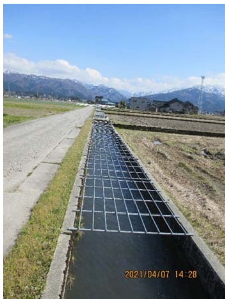
完成した水路の鉄筋フタ