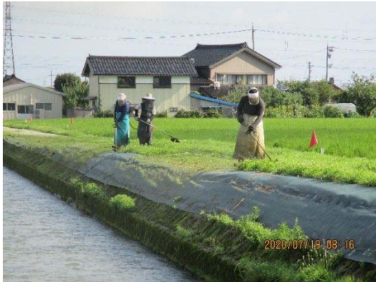
共同草刈りの様子