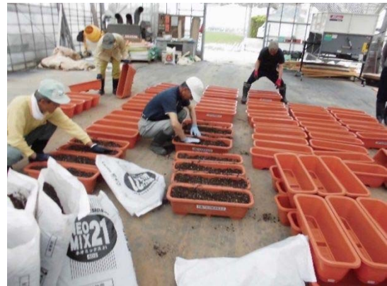
プランター植栽：役員による準備