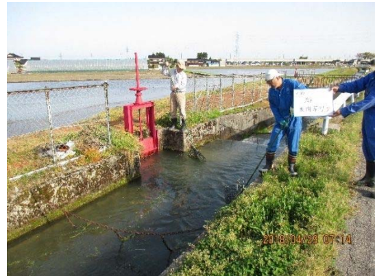
下流に流れないように草のすき取り