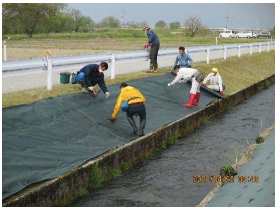
防草シート張りの様子