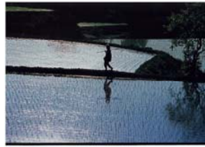
銅賞「棚田のみまわり」