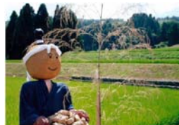
「こゆっくりどうぞ」