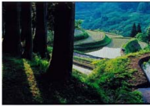
銅賞「里山の田回り」