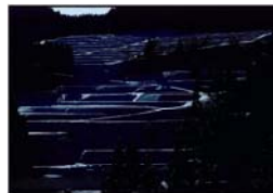
「クリスタルライン」