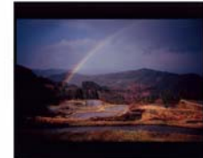
「明日へのかけはし」