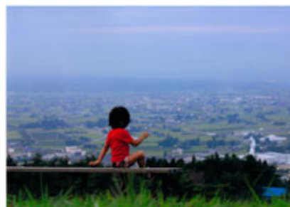
▲優秀賞 「おうちどこ？」