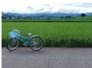
▲「暑い夏に育った 稲と私の自転車」