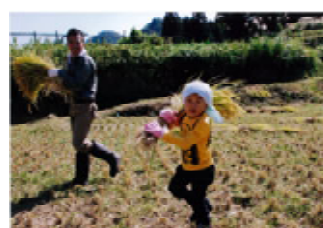
▲「たくさん刈ったよ！」