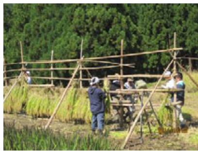
(ハサ掛けでいっそうおいしく！)