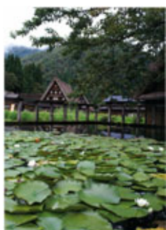
▲「すがぬまのたんぼ」