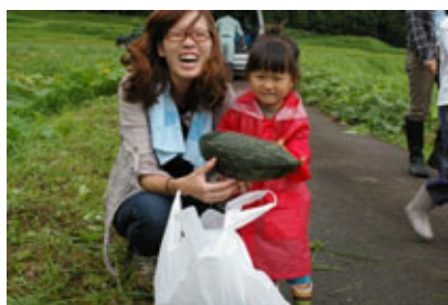
(おかあさんといっしょに 収穫を楽しんだわたし)