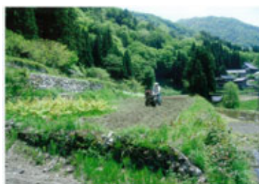
▲「畑仕事は大へんだな」