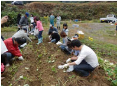
(さつまいも収穫スタート)

10月23日(日)、南砺市土山でさつまいもの収穫が行われました。地元とTOTO(株)北陸支社の総勢62名による収穫作業。みんなで6月に植えた苗は立派に成長しているかな？