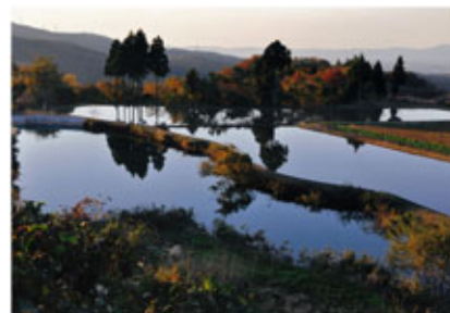
▲優秀賞 「晩秋の水田」