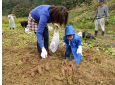
(たくさん出ておいで!!)