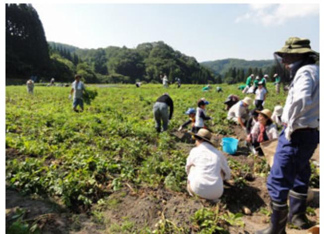
(じゃがいもの収穫体験)