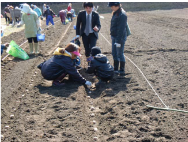
(オーナーによる種芋の植付け体験)

4月17日(日)には、市内外から参加した18組30人のオーナーが、地元住民と一緒に、じゃがいもの種芋の植付け作業を、7月17日(日)には、じゃがいもの収穫作業を体験しました。収穫した、じゃがいもの一部は、ゆでて試食し、地域住民と参加者との交流を深めました。