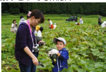
(おもたい五箇山かぼちゃを ひっしに抱えるぼく)

朝から雨模様で、開催が危ぶまれましたが、集合時間には天候も回復し、さっそくみょうが畑へ出発！ 参加された親子は「夏休みの楽しい思い出ができた！」とご満足なご様子。子どもたちの笑顔がとっても素敵！