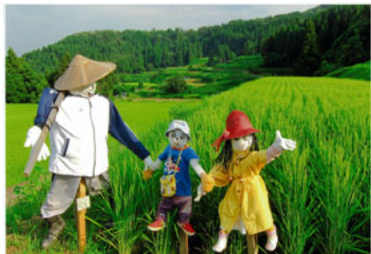
▲最優秀賞 「カカシ親子」