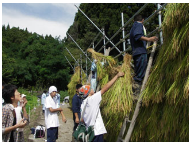
(氷見高校生によるはさがけ作業)