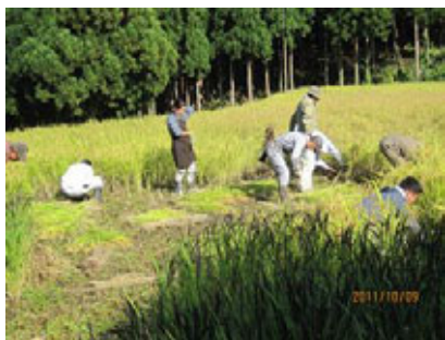
(なかなかはいかんな～)

10月9日、南砺市利賀村坂上で、利賀百姓塾“秋編”収穫祭が絶好の好天に恵まれた中で開催されました。嬉しい収穫の秋です。紅葉を間近に控えた山並を背景に、春にみんなで植えた有機米の稲刈りが始まりました。