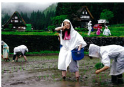
▲優秀賞 「雨の日の田植え」