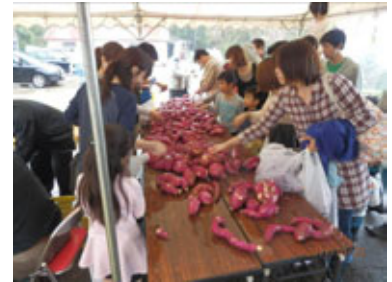
(どれも大きくておいしそう^^)

参加した親子がさつまいもの根元を掘り起こすと、大きく成長したさつまいもがざくざくと！用意した軽四トラックの荷台は、さつまいもの山ができる程の大収穫でした。途中雨が降ったりして大変でしたが、地元の皆さんが公民館に用意したテントを利用して、収穫物の品定め。収穫作業の後には参加者全員で収穫祭が行われ、地元料理を堪能しました。