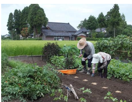
▲「たねをうえているところ」