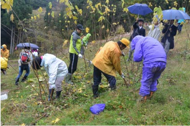
楮の刈り取り作業

五箇山和紙の原料となる楮の生産・管理・収穫等の体験活動を通し、国指定の伝統工芸の魅力を発信するとともに、技術の継承の大切さを広めるなど、棚田の保全や地域振興に努めています。