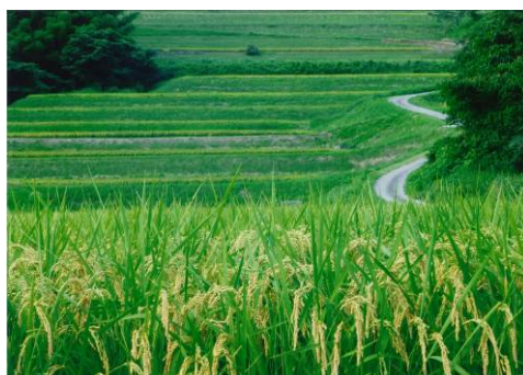
▲「かいだんみたいな田んぼ」