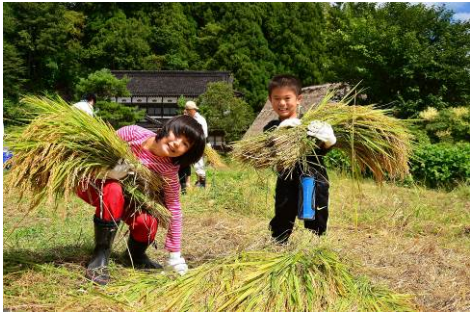
▲最優秀賞 「稲刈 楽しく学ぶ」