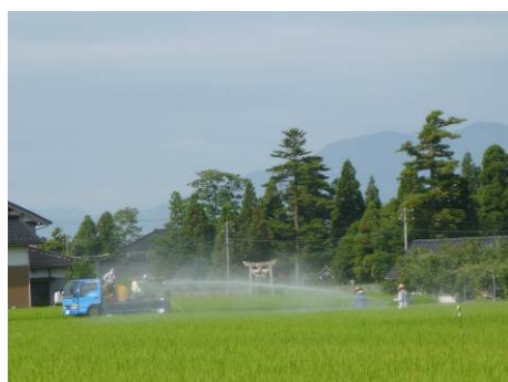
▲「水稲共同防除作業」