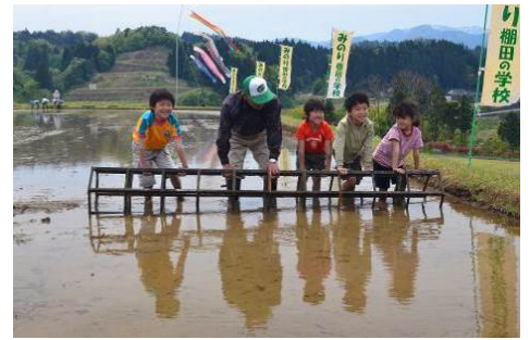
▲優秀賞 「棚田の学校」