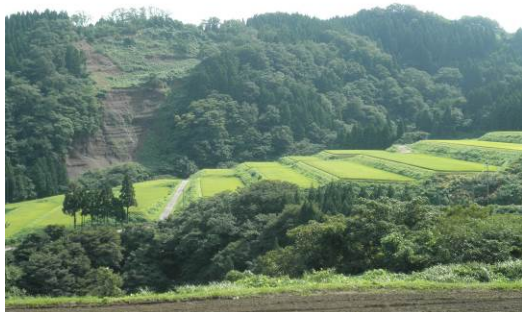
▲最優秀賞 「田んぼのかいだん」