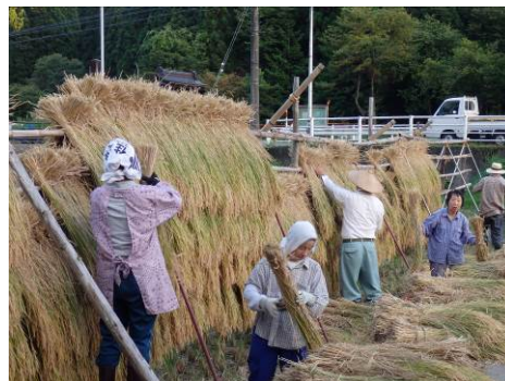
▲優秀賞 「みんなで力を合わせて」