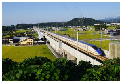
▲「実りの富山路を快走する北陸新幹線」