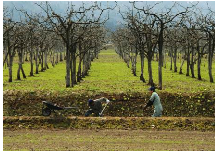
▲優秀賞 「芽吹きのに里」