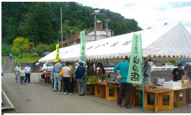
よだけの山まつり

荒間集落では、県単独事業を活用して耕作放棄地の復旧に取り組んできました。本年度は、復旧した農地を活用し山ウドやスクナカボチャを栽培し、「山の店」の直売所で販売を行いました。さらに、9月21日には廃校となった旧岩尾滝小学校の敷地内において、南谷地区振興会主催の「よだけの山まつり」（よだけ=岩尾滝）が開催され、市内はもとより県内他市や金沢市からもお客様が訪れてにぎわい、地域の活性化に寄与しています。