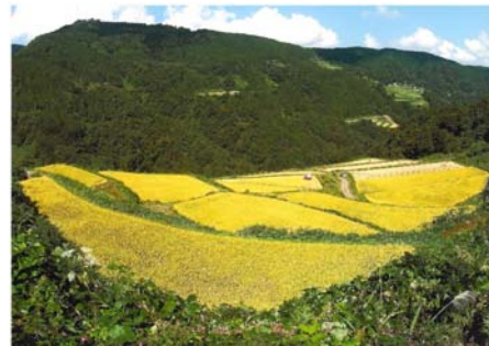
▲「黄金色映える棚田」