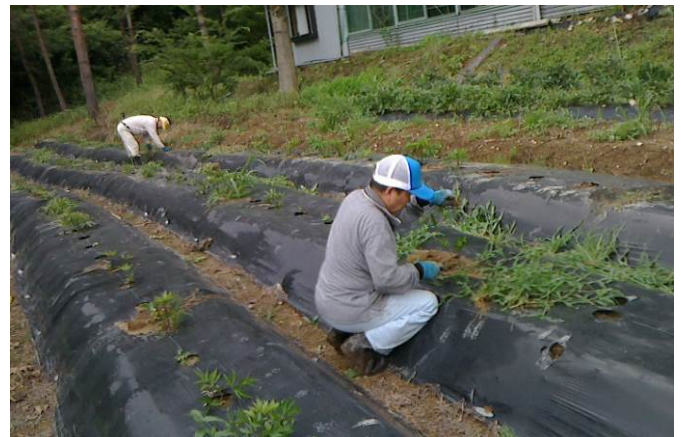
刈取り作業 (トウキ)