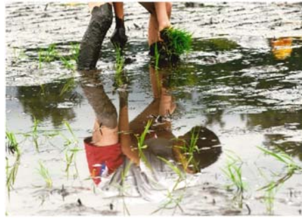
▲最優秀賞 「体験学習」