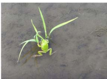
▲「おぼれる者は苗をもつかむ」