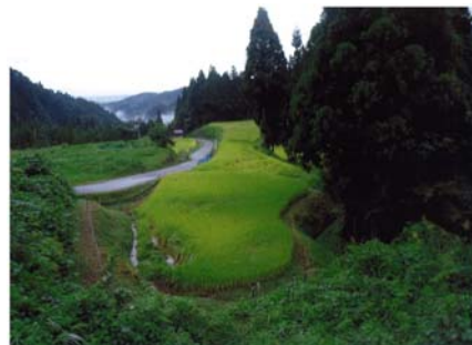
◀「みどりがいっぱい」