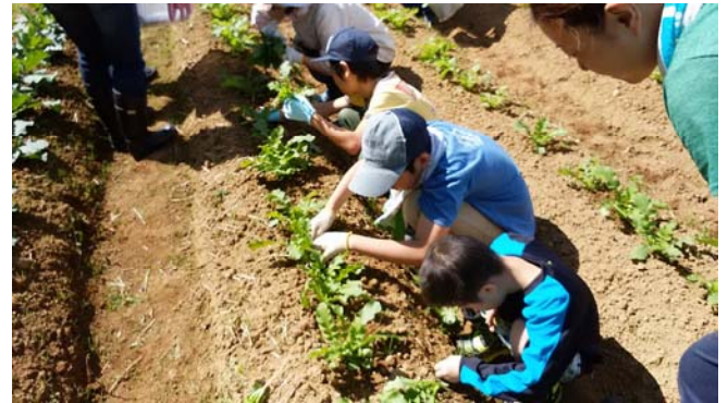
だいこん間引き作業体験