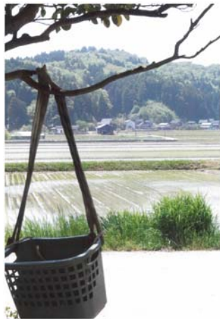
▲最優秀賞 「田植えフィニッシュ」