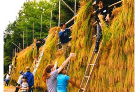
▲優秀賞 「収穫の喜び」