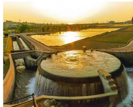
▲優秀賞 「夕日に染まる円筒分水槽」