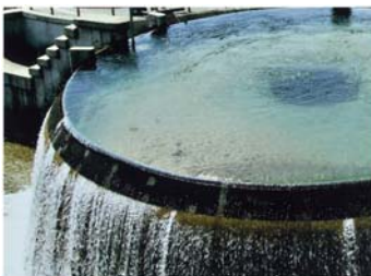
▲「円筒分水槽(東山右岸)」