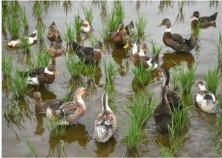
▲優秀賞 「除草アイカモ」