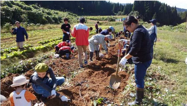
さつまいも収穫体験

富山市山田清水地区は山田地域の西部に位置し、全体農用地 46.3ha のうち 67.5%が急傾斜地を持つ地区です。一方、準高冷地の冷涼な気候で寒暖差を活かした農産物の食味が評判であることから、誰もが気軽に参加できるノーマライズな体験農園活動（福祉農園）を通して都市部や障害者の人々と交流活動に取り組んでいます。本年度は、じゃがいも・とうもろこし・さつまいも・白菜・だいこん・かぶ等の多品目にわたって、定植・間引き作業・収穫の各種イベント体験を実施し静かな山里での賑わいを創出しています。