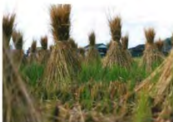
▲「こびとさんのおうち」