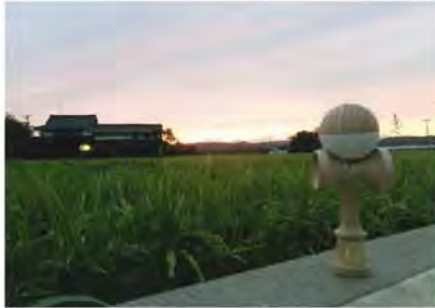
▲最優秀賞 「けん玉と自然」