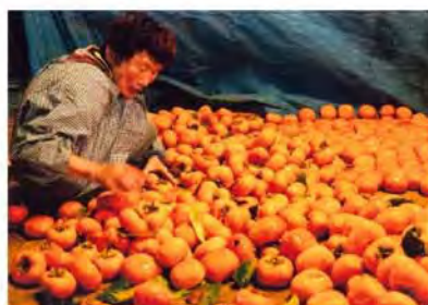
▲優秀賞 「柿とぼあちゃん」