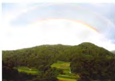
▲「幸運を呼ぶ二重虹」