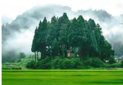
▲最優秀賞 「鎮守の杜」