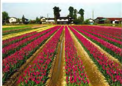
▲優秀賞 「つかの間の満開」