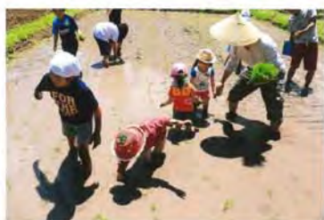
▲「みんなでお手伝い」