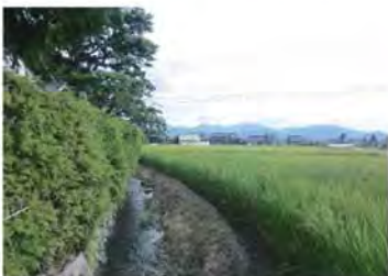
▲ 「富山のきれいな農山村」