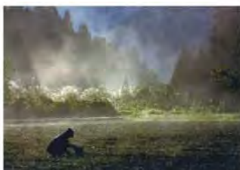
▲「朝靄のらっきょ畑」