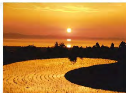
▲「おらが村自慢の夕景」