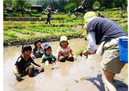
▲「お母さん頑張って！」