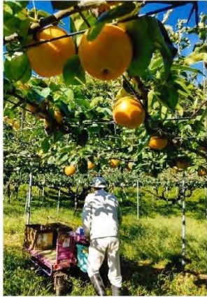
▲「しゅうかくを待つ梨たち」