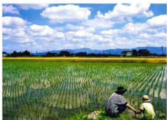
▲「おいしいお米になあれ！」