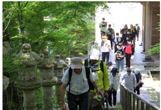
天平夢の里ウォーキング