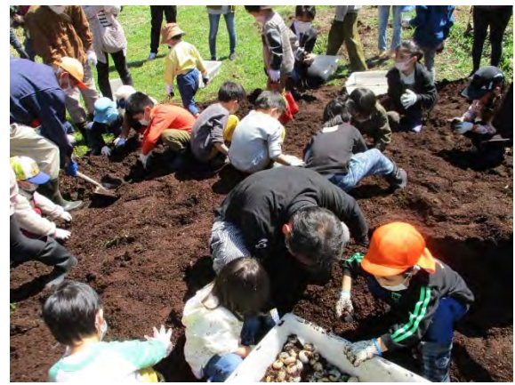
カブトムシ幼虫掘り