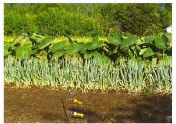
▲「じいちゃんの さといもばたけ」