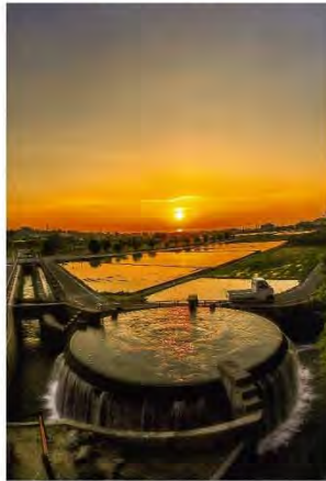
▲「日本一美しい 円筒分水槽と夕陽」