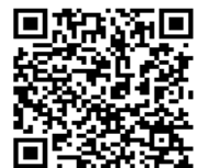
富山地方法務局ホームページ QRコード

富山地方法務局 076-441-0550 魚津支局 0765-22-0461 高岡支局 0766-22-2327 砺波支局 0763-32-2361