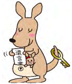
遺言書ほかんガルー

遺言書保管申請手続には予約が必要です。 詳しくは、法務局にお問い合わせください。